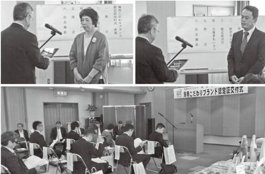
認定交付式＝10月15日海南商工会議所で

海南商工会議所では、10月15日(水)午前10時から第7回海南こだわりブランド認定商品の認定証交付式を開催し、正副会頭、常議員はじめ、新規認定・再認定された事業所の方が出席した。