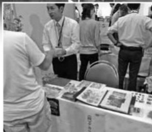
(株)タカラ製菓さん