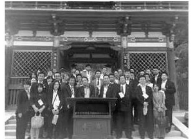
第2分科会では、勝運のお寺・ダルマで有名な勝尾寺の参拝。勝運祈願を受けた

大会は、経済・社会環境が大きく変化する中で、企業と地域社会の次代を担う青年経済人が互いに交流と連携の輪を拡げ、企業の発展と豊かな地域社会の形成に果たす商工会議所の役割を認識し、その実現のために青年経済人として何をなすべきかを研究し研鑽することを目的とし開催され、近畿各地などから約2,000名が参加。3日には近畿ブロックYEG総会・会長会議等が、4日には記念式典・分科会・交流会等が開催された。