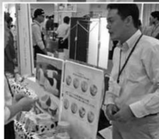
農事組合法人黒沢牧場さん