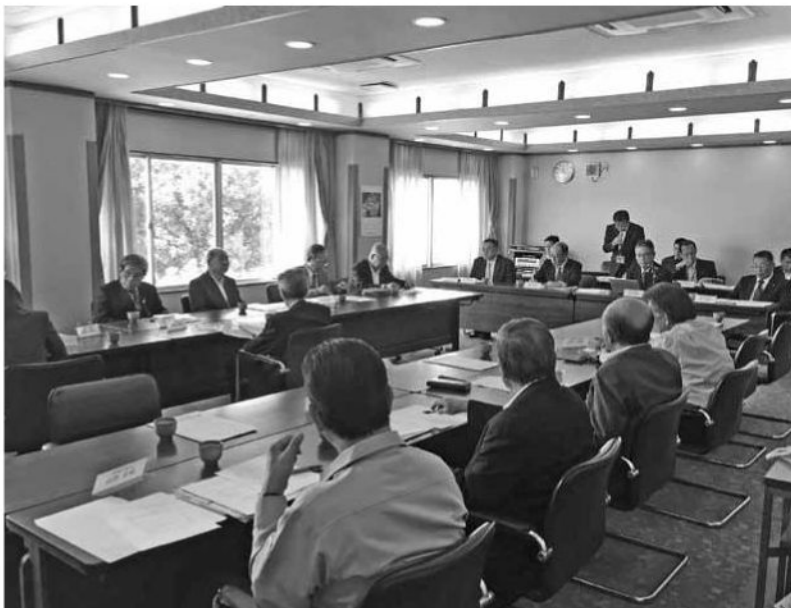
10月15日常議員会を開催