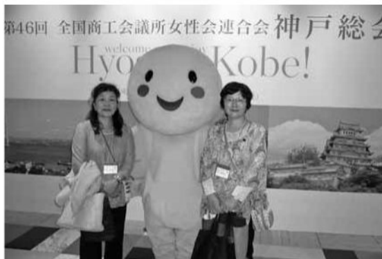
兵庫県キャラクター「はばタン」と会場にて

また、「女性が生き活きと活躍し、楽しく子育てができる地域の実現」を目指し、「行動する女性会」を世の中に強く打ち出そうと“神戸アピール”を採択。最後に、来年の開催地・石川県商工会議所女性会連合会が次回の石川大会をPRして総会を締めくくった。