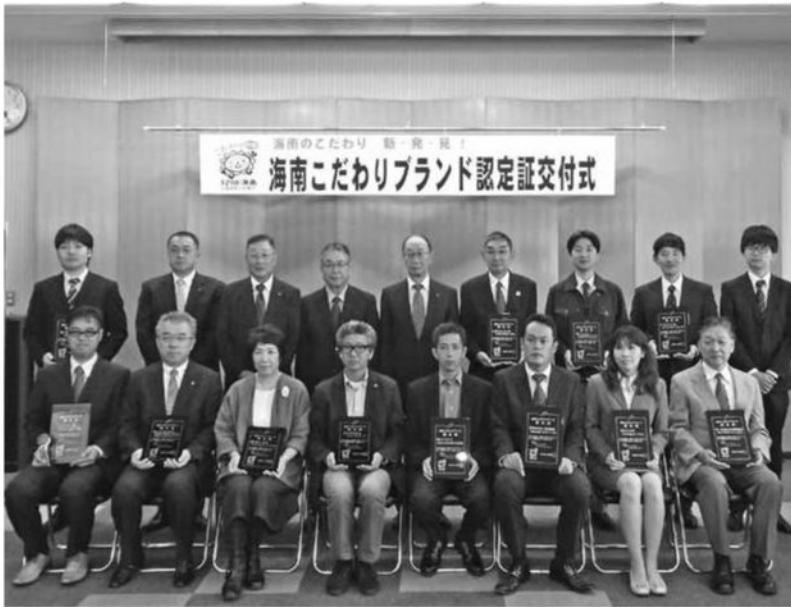
10月15日第7回海南こだわりブランド認定証交付式